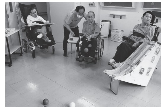
スポーツレクリエーション